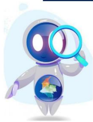
PROCENTAJE DE CUMPLIMIENTO EVALUACION SISTEMA DE CONTROL INTERNO 2022

La efectividad del Sistema de Control Interno se evalúa semestralmente. Conoce como su porcentaje de avance del 2022