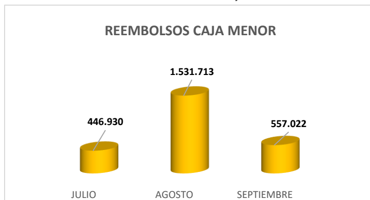
Cuadro No 1. Reembolsos Caja Menor